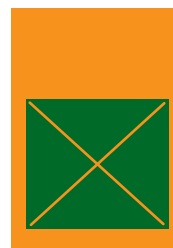
2/3 strany 176x175