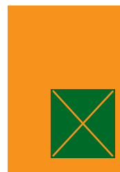
1/3 strany 116x125