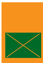
1/2 strany 176x125