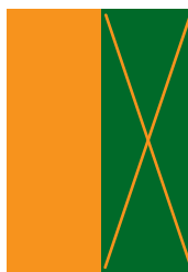
1/2 strany 105x297