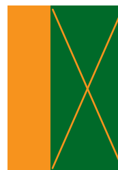
2/3 strany 134x297