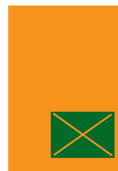
1/4 strany 116x80