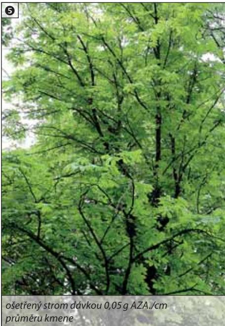
ošetřený strom dávkou 0,05 g AZA./cm průměru kmene