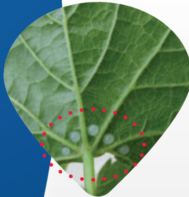
Kapky Videryo F na spodní straně listů